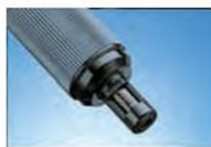
Устанавливаемое усилие: 2-10 Н (227-223)