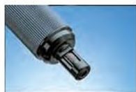
Устанавливаемое усилие: 0,5-2,5 Н (227-221)

(1) Действительно только при отклонении инструмента в пределах ±3° от горизонтали при измерениях.